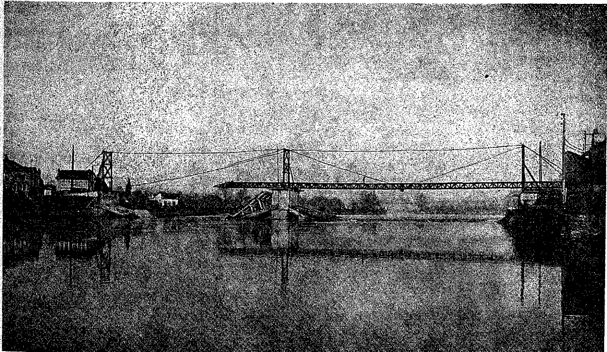
PONT PROVISOIRE SUSPENDU DE DECIZE SUR LA LOIRE NAVIGABLE, EN COURS DE MONTAGE

SIÈGE SOCIAL ÉCOLE NATIONALE DES PONTS & CHAUSSEES 28, Rue des Saints Pères PARIS